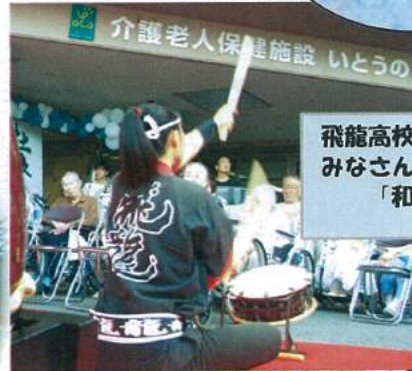
飛龍高校のみなさん「和太鼓演奏」