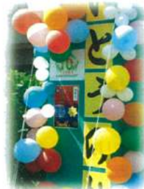
いとうの杜祭り マスコット