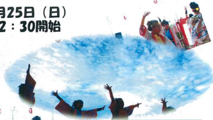
いとう舞士童の みなさん 「よさこい」