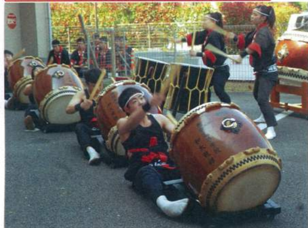
飛龍高校 和太鼓部 演奏