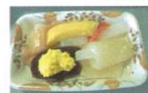
ソフト食の お寿司