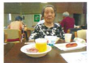
夏はやっぱりこれだね！ (ビールではありません)