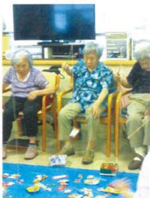
皆さんお菓子を上手に釣りあげていました