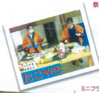
祭囃子を聞きながら たこ焼きを頑張る 「美味しいね」に、焼き立て最高！ by稲葉