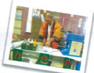
「何のシロップをかけようかな？」 皆様笑いながら迷っていました 私も食べたかった😊 by中山

毎年恒例の通所夏祭りが行われました。 ゲームコーナーでお菓子を吊り上げGet！。 屋台コーナーで腹ごしらえをして、舞台ではスタッフによる二人羽織で大笑いをしました。