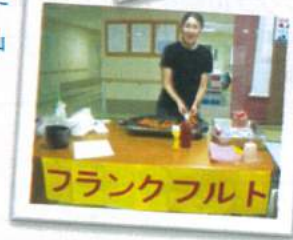
ミニフランクだったので、短時間でOK！ 2本3本とおかわりする方が いました by長津