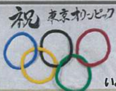
いよいよオリンピックイヤーです!