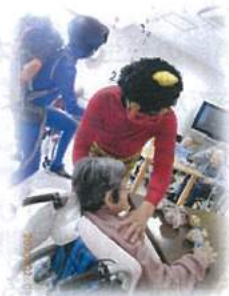
初めは勢いがあったが...