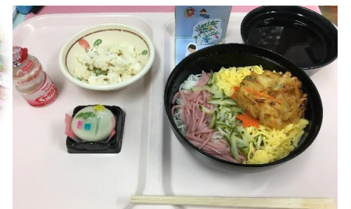
それぞれのフロアで... それぞれの七夕様...