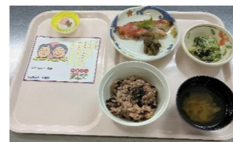
敬老の日メニュー

9月19日は敬老の日でした。いとうの杜の利用者様のほとんどの方、敬老の日おめでとうございます。通所ご利用の方、ショートステイご利用の方、そして入所されている方で100歳を超えた方は10名程おられます。これからも長生きしてくださいね。