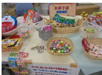
昔懐かし駄菓子屋さん