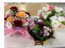
ご家族からお花を