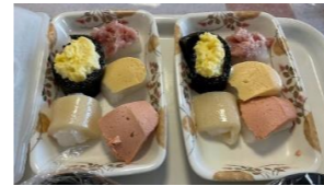
ソフト食の方用お寿司

朝から利用者様たちは、「今日はお昼がお寿司でしょ?」「ひさしぶりにお寿司なんて食べられるわ」と楽しみにしていました。寿司バイキングが始まると、「あら?今日は何のお祝い?」「すごいわねえ」と普段小食の方も沢山召し上がっていただきました。「携帯で写真を撮るよ」とお部屋に携帯電話を取りに戻る方もいました。「毎日寿司がいいな」など嬉びの声を頂きました。 2階 内田