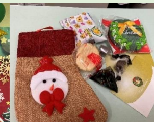
5階 お菓子の掴み取り