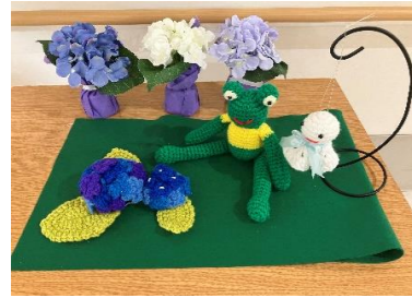
もうすっかり梅雨の季節

『明けない夜はない、やまない雨はない』といった感じです。しかし、他の感染症（インフルエンザ）や食中毒発生のニュース等耳にします。利用者様が安全で安心できる施設生活を送れるように努力していきたいと思ひます。