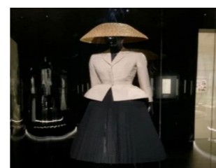
1947年の「パースーツ」彼が提案した絞ったウエストとたっぷりしたスカートが特徴のデザインは「ニュールック」と呼ばれ、旋風を巻き起こした