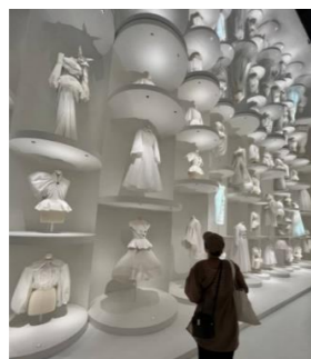
白い空間で目を奪