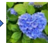
紫陽花群生地 後でよく見たら女の人がポーズをとりました