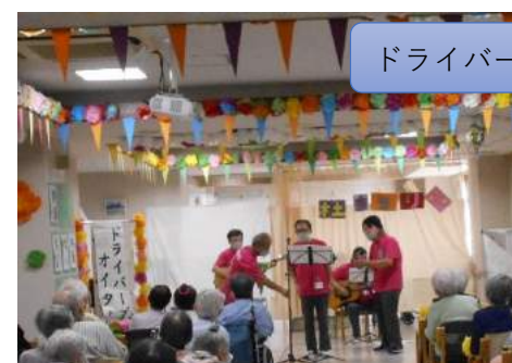
ドライバーオイターズ