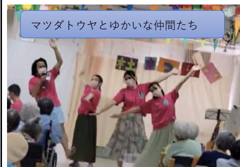
マツダトウヤとゆかいな仲間たち