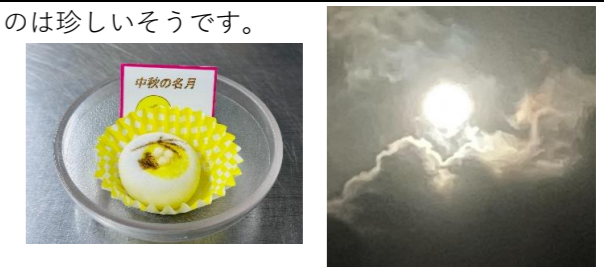
スマホで撮るのは難しい

今年の中秋の名月は9月29日、満月と重なるのは珍しいそうです。次回重なるのは7年後とか…… いとうの杜のおやつはこんな感じで提供しました。